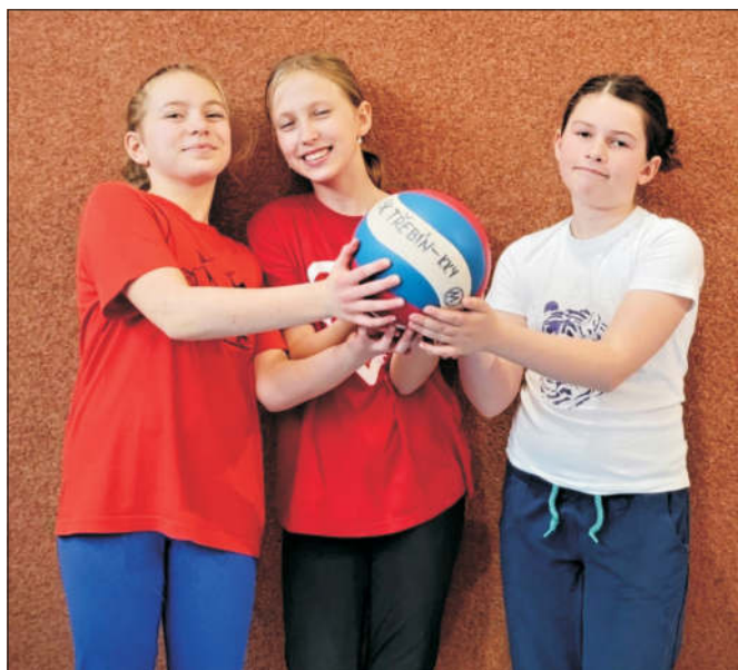
Minivolejbal – červený tým