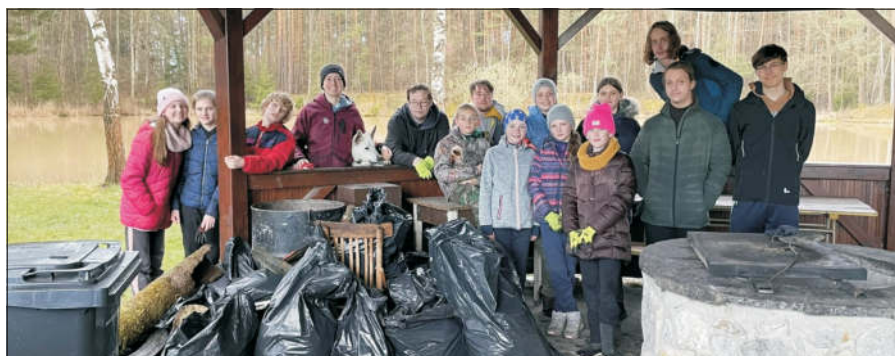
Přírodovědný oddíl Žraloci Ledenice

Cena 1.200 Kč/rok, informace na tel. 389 604 754