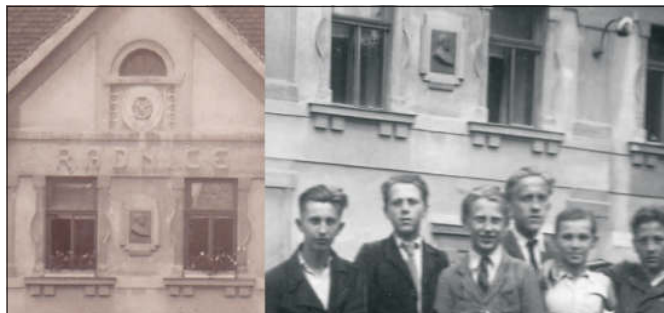
Výřezy z fotografií s pamětní deskou Antonína Švehly mezi okny radnice

V závěru Švehlova života a po úmrtí se z úcty k němu začaly po celé zemi objevovat různé připomínky jeho osoby. Měli jsme v Českoslo-