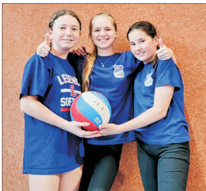
Minivolejbal – modrý tým