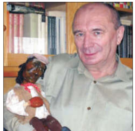
Jako loutkař a divadelník. V roce 1975 založil v Ledenicích Loutkářský soubor Krajánek