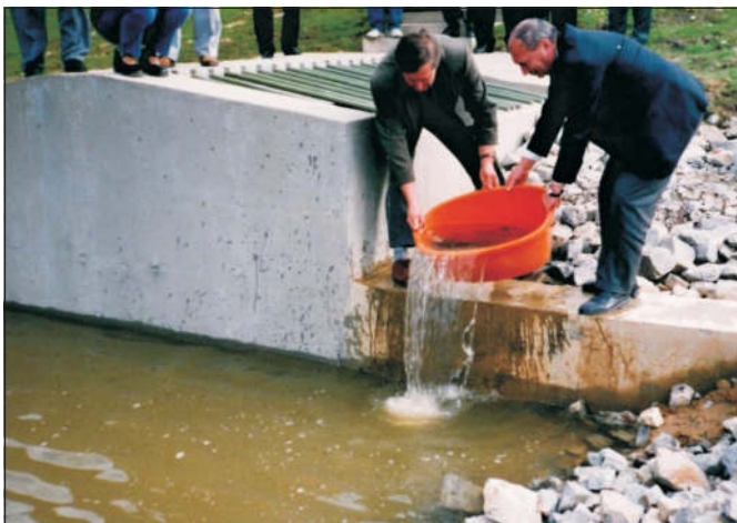
Rok 1999 – obnova téměř zaniklého rybníka Kačerovec. Jedno z prvních dokončených protipovodňových opatření. Na fotografii je symbolické zarybnění rybníka

Rodina děkuje za účast a projevenou soustrast