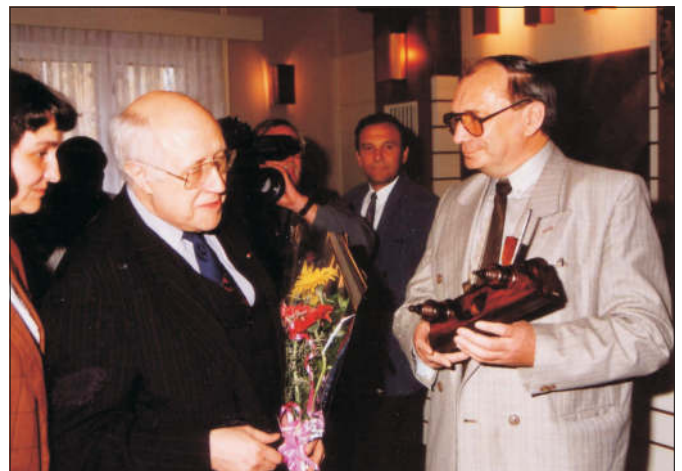
Rok 1997 – předání daru M. L. Rostropovičovi – ruskému violoncellistovi a dirigentu, který byl v SSSR perzekuován za podporu disidentů a který několikrát navštívil Ledenice