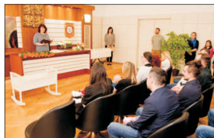
Vítání malých občánků