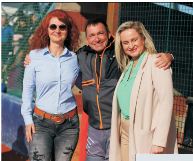
Slavnostního zahájení se zúčastnili i zástupci partnerských firem Atkinson Partners, Photomate a Realdomus