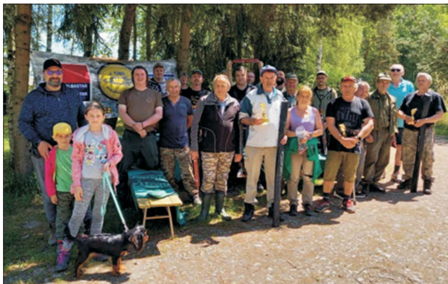
Memoriál Jaroslava Cukra