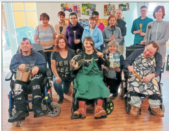
V Denním centru v rámci návku činnosti vaříme zdravá jarní jídla