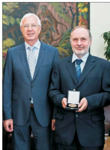
S předsedou Akademie věd ČR Jiřím Drahošem po udělení medaile G. J. Mendela za přínos v biologických vědách (2016)

Velkou porci času zabere psaní a administrace projektů, ze kterých je výzkum financován. Například naše oddělení dostává necelou jednu třetinu peněz od státu jako veřejná výzkumná instituce, zbytek si musíme vysoutěžit v podobě grantů. Většina našich projektů pochází od Grantové agentury ČR nebo z mezinárodních soutěží. Všechny tyto projekty prochází náročným, nejméně dvojkolovým posuzováním, jehož se účastní nezávisle na sobě několik vědců. U Grantové agentury ČR to bývá 6 až 8 domácích a minimálně 2 zahraniční oponenti, experti v daném oboru. To znamená, že nám nestačí, jak se občas někdo naivně domnívá, natáhnout ruku a říct: „Mám nápad, dejte mi na něj peníze“. Je třeba prokázat, že to, co chceme řešit, je skutečně nové, smysluplné a že na to opravdu máme znalosti, zkušenosti i vybavení. A o tom, že to není úplně jednoduché, svědčí skutečnost, že v konkurenci ostatních uspěje v českých sou-