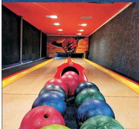
Dvě bowlingové dráhy

SEMINÁŘE, ŠKOLENÍ, FIREMNÍ AKCE, SVATBY, KONCERTY, SPORTOVNÍ SOUSTŘEDĚNÍ, SOUKROMÉ AKCE