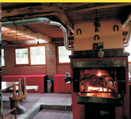
Terasa s krbem