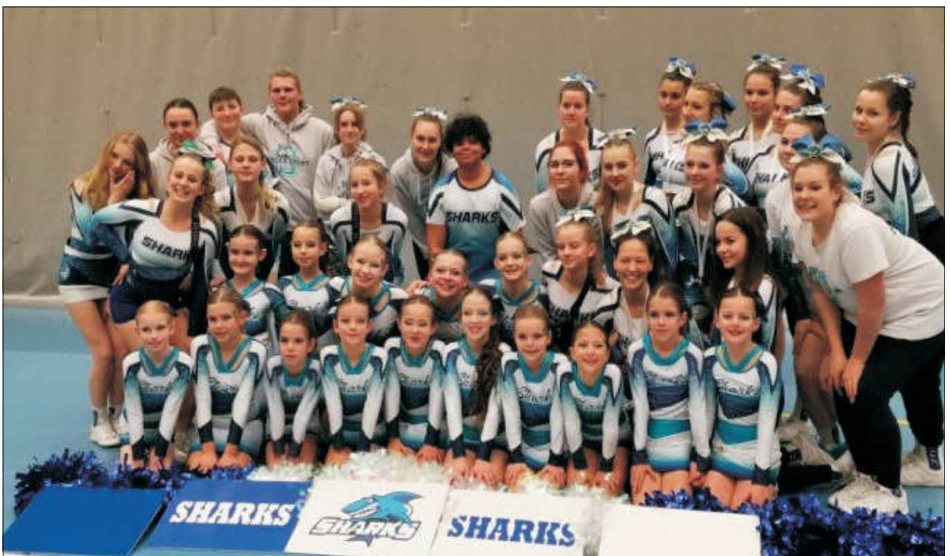
Sharks cheerleaders, soutěžní výprava na Evolution cheer battle 2023