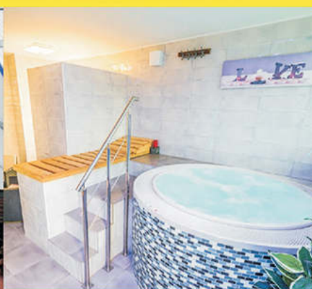
Whirlpool bazén se saunou

Relaxcentrum Mrkáček Lišov, Dolní 865, 373 72 Lišov info@sport-mrkacek.cz, 775 297 061