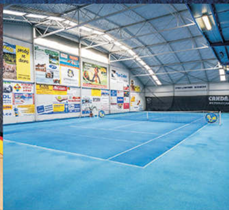
Dvě tenisové haly