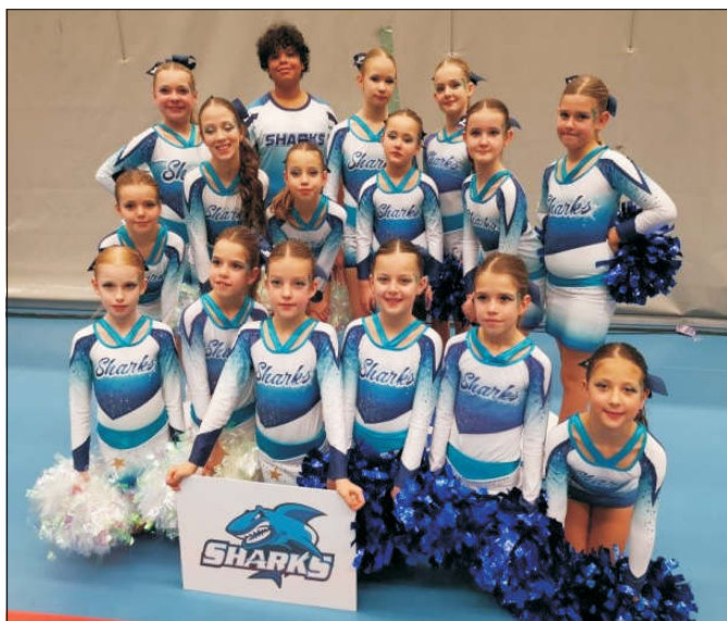
Sharks – Totally Jungle, Team cheer tiny Novice