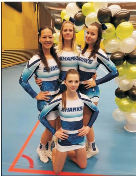
Sharks Attacks, Group stunt senior Advanced