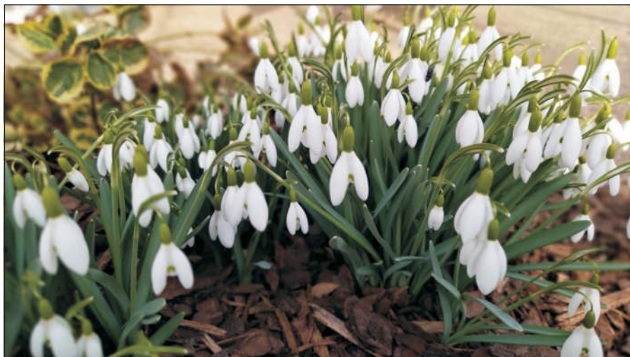
Zahrady již zdobí rozkvetlé sněženky