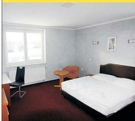
Hotel s kapacitou 32 lůžek