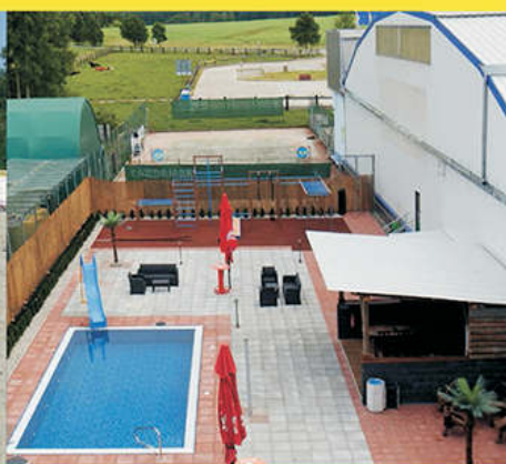
Bazén s venkovní posilovnou