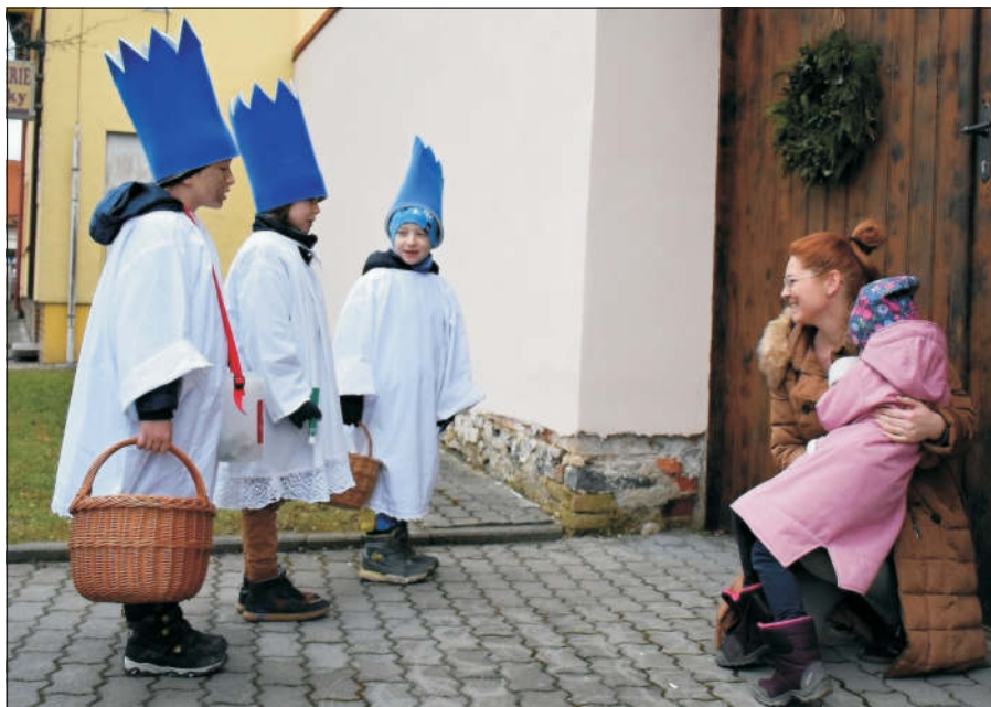
I letos v lednu prošli Ledenicemi a osadami tříkráloví koledníci. O tom, jak byla sbírka úspěšná a kolik dobrovolníků se na ní podílelo, si můžete přečíst na str. 6 a 7