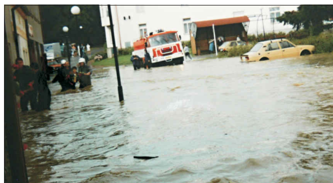
Dolní náměstí r. 1997