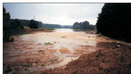
Louky za čističkou r. 2002

Děkujeme manželům Květě a Františku Fabiánovým za laskavé zapůjčení fotografií povodně z roku 1997.