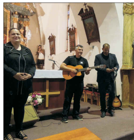
Závěr večera patřil tradičně skvělé ledenické skupině Gipsy Suno