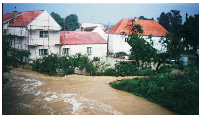
Spolský potok v Lazenské ulici r. 1997