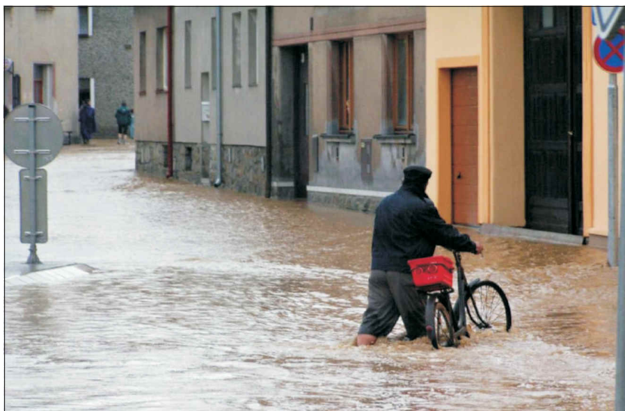
V srpnu uplyne již 15 let od chvíle, kdy se Ledenicemi prohnala poslední ničivá povodeň. Více o povodních na str. 6 a 7