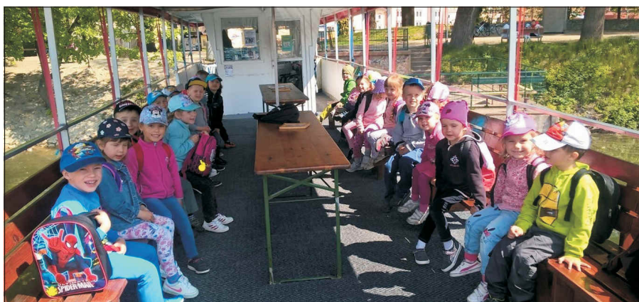
Z mateřské školy – Výlet do Třeboně