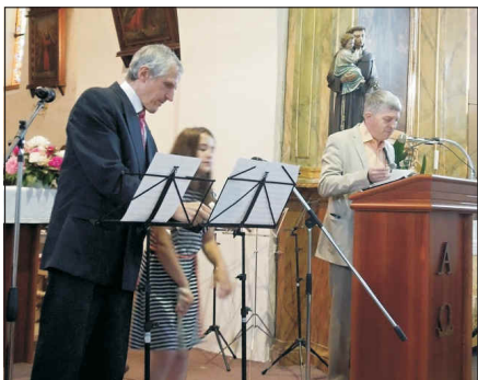
Zahájení Noci kostelů obvyklým koncertem ledenické ZUŠ