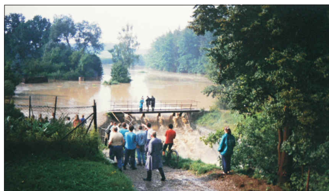
Rybník Lazna r. 1997