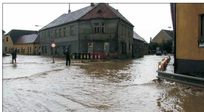
Křížovatka Budějovické a Trocnovské ulice (dnešní kruhový objezd) r. 1997