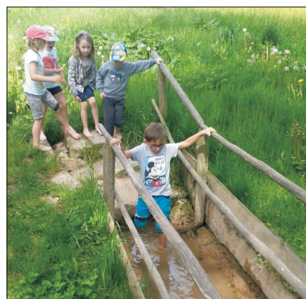
Z mateřské školy – Pejsci a Sluníčka v Zeměráji