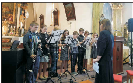
Flémový sbor sklídl velký potlesk