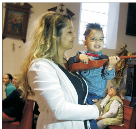
Rozjásaný nejmenší muzikant přispěl k rodinné atmosféře