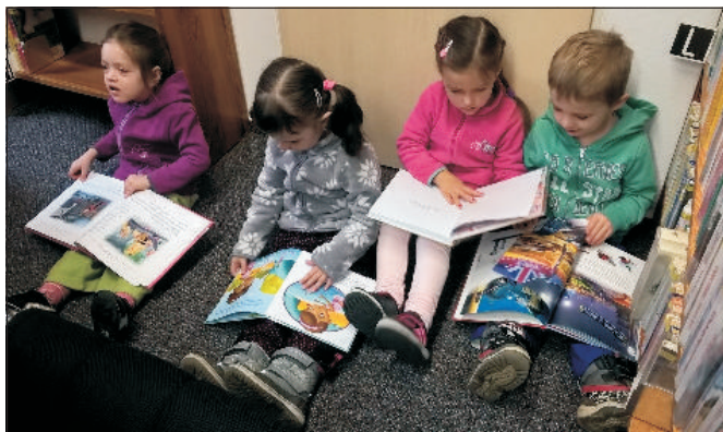
V měsíci čtenářů nás navštívily děti z mateřské školy. Prohlédly si celou knihovnu a v dětském oddělení pobesedovaly nad pohádkovými knížkami. Na fotografii třída Ježečků