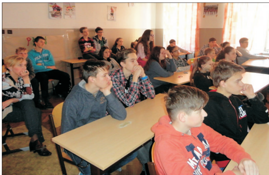
Posloucháme přednášku o Indii

Čtenářskou gramotnost se naši učitelé snaží posilovat nejen v hodinách českého jazyka a literatury, ale i v rámci ostatních předmětů a mezipředmětových vztahů tak, aby se naše děti dokázaly nejen orientovat ve sdělovaném,