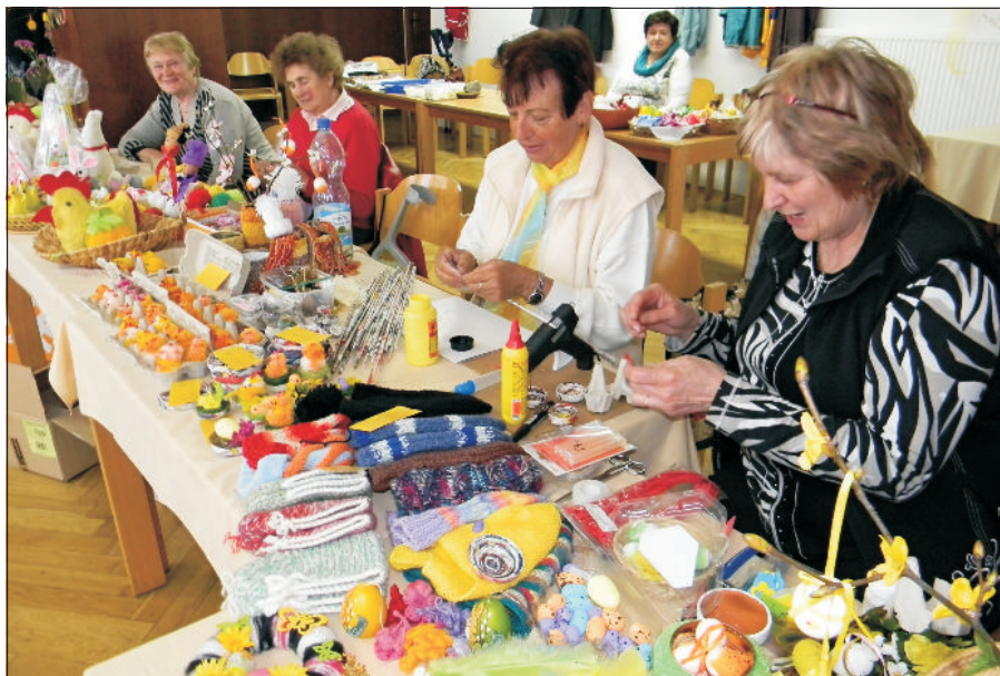
Jaká byla letošní velikonoční výstava, si můžete přečíst na str. 6 v článku Výstava šikovných rukou