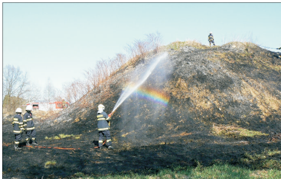
Prvního dubna vyjžděli ledeničtí hasiči k požáru trávy ve Srubci (Na Štětkách)