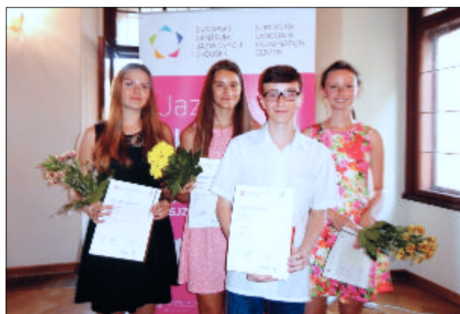
Žáci lednické školy při přebírání certifikátů zkoušek KET na českobudějovické radnici