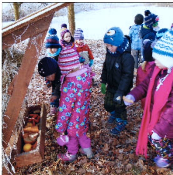
Vycházka ke krmelci