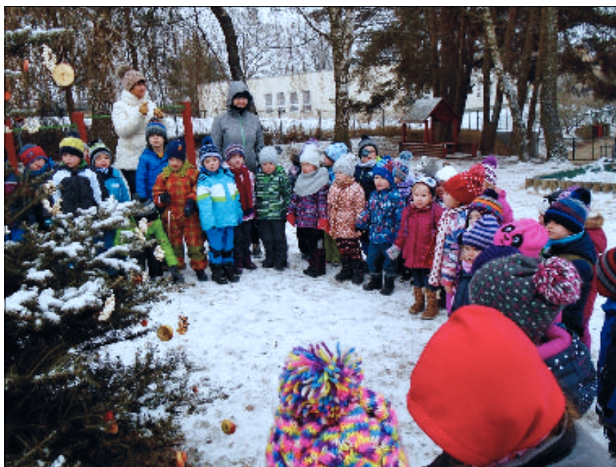
Společné zpívání vánočních koled na zahradě MŠ