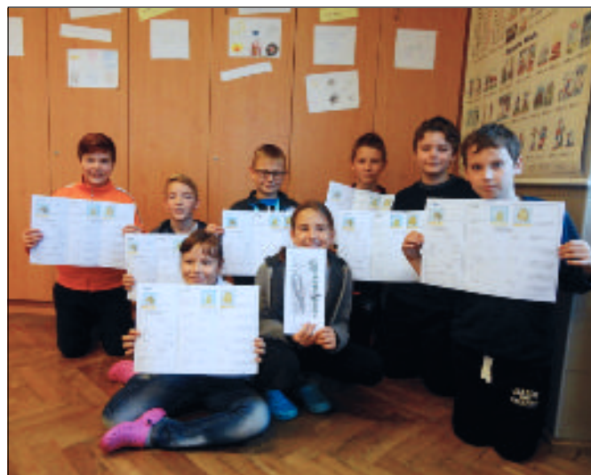
I třída pátáků se zapojila do vzdělávacího programu Stromy jako domy

né výchově a v pracovním vyučování se pro tuto příležitost pilně kreslilo, stříhalo a lepilo.