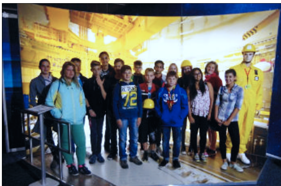
Osmáci a devátáci na interaktivní technické výstavě Accelerating Science

Atmosféra a duch Vánoc přišel neodvratně s jehličím borovic a smrků, které si děti přinesly do školy. V každé třídě si postavily stromek, nastrojily a neopomenuly ani slavnostní výzdobu stěn a oken. Všichni se tak trochu předháněli a pyšnili se právě tou svou. Ve výtvar-