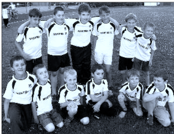
Mladší příprava Slavoj Ledenice – vítěz OS Č. B. 2012–2013