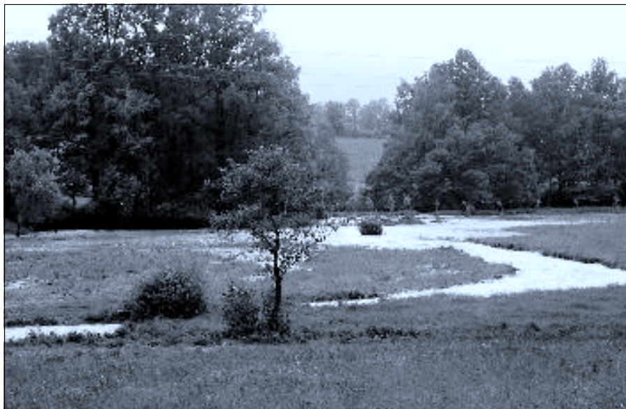
Vodou zalitá cesta k Hejnům