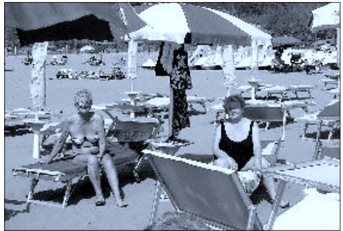
Pohoda na pláži