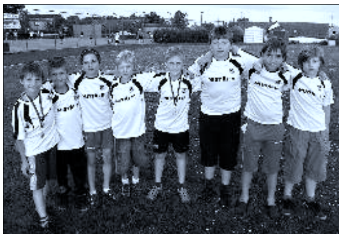
Starší příprava Slavoj Ledenice – vítěz OS Č. B. 2012–2013