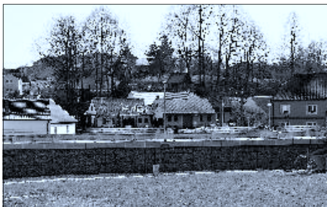
Pohled na hradní pahorek od severu (z hráze rybníka Lazný)

Od východu (od Růžova), kde je plochý terén, stávala patrně menší obranná tvrz, z níž mělo být pomocí bubnů oznámeno posádce hradu hrozící nebezpečí (místu se říká Malý hrad, Hrádek nebo Boubín – podle bubnů). Po zániku hradu vznikl v jeho sousedství hospodářský dvůr a dnes zde stojí rodinné domy. Při jejich stavbách a úpravách se při výkopech hojně nacházely zbytky kamení, ohořelých dřev či sklepní prostory. Nic z toho však bohužel nebylo nijak blíže zdokumentováno. Občas se na svazích ostrohu naleznou zbytky středověké keramiky. Největšími památkami na hrad tak zůstávají oficiální pomístní názvy Hrad a Hradské rybníky. Na oboru, zaniklou spolu s hradem a přeměněnou na park, zase upomínají jména Na Oborách, Park (dnes již nepoužívané označení části obce kolem cesty do Růžova) a Parkského/Parského rybníka (Parčáku). Mgr. Jiří Cukr