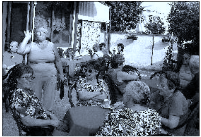
Odpočinek na terase hotelové kavárny