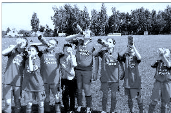
Starší příprava – oslava mistrovského titulu!

Naše squadra azzura je jako dobře promazaný stroj, vyladěný tím nejlepším mechanikem. Ťukes, který naposledy předváděla Barcelona, tvrdost a tah na branku, kterými se pyšní Bayern, individuální technické finesy á la Brazil. To všechno bylo k vidění na jednom jediném místě v podání jediného týmu – mladší přípravy Ledenic. Naši miláčci zakončili fantastickou sezónu jistým vítězstvím nad Boršovem 9:3. Je to tak. Během šesti dnů slaví Ledenice druhý mistrovský titul. Jsme mistři! Zase!