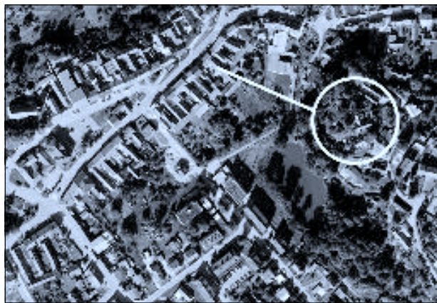
Letecký pohled na Ledenic s předpokládaným rozsahem bývalého hradu a mostem, spojujícím hrad s centrem městečka

Prostor hradu nebyl nikdy odborně prozkoumán a ani se nedochovalo žádné vyobrazení, proto o podobě sídla nemůže říct prakticky nic. Kamenné zbytky si zřejmě postupně rozebírali místní občané pro různé stavební účely. Jednalo o nevelký objekt s kamennými základy a dřevěnými nástavbami. Stával na ostrohu na východním okraji