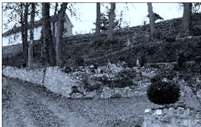
Terasovité zahrady a úvozová cesta pod domem čp. 38 (Votrubů)