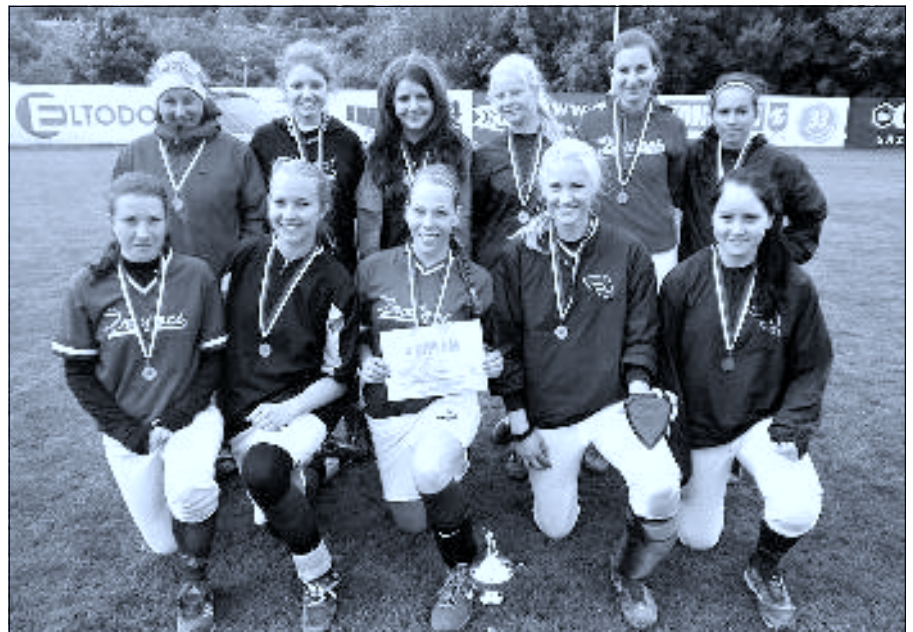
2. místo na open M-ČR juniorek letos 25. 5. 2013