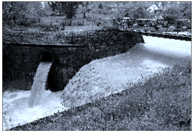
Odtok z rybníka Lazna