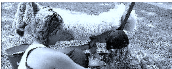
Kdo si někdy vyzkoušel, jak se dojí ovečka?