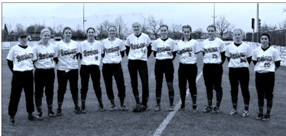
Tým lednických žen na Jouders Cupu