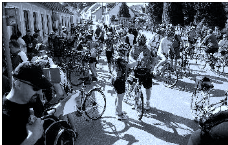
Jízda pro Růži 2011 – občerstvovací zastávka v Ledenicích. Z důvodu zvýšení bezpečnosti cyklistů bude v letošním roce zastávka v Ledenicích přesunuta na parkoviště před hřbitovem