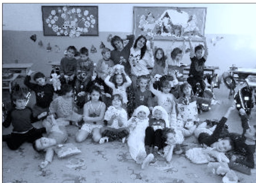
Pyžamový den v 1. třídě