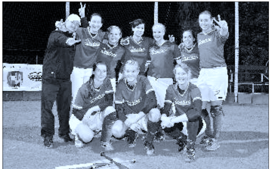
foto z kvalifikace žen o 2. národní ligu žen