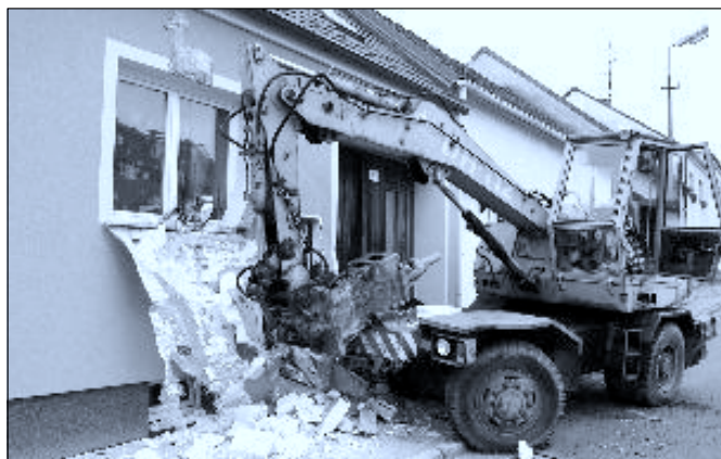
Ve čtvrtek 18. října došlo v podvečerních hodinách k neobvyklé dopravní nehodě v Trocnovské ulici.