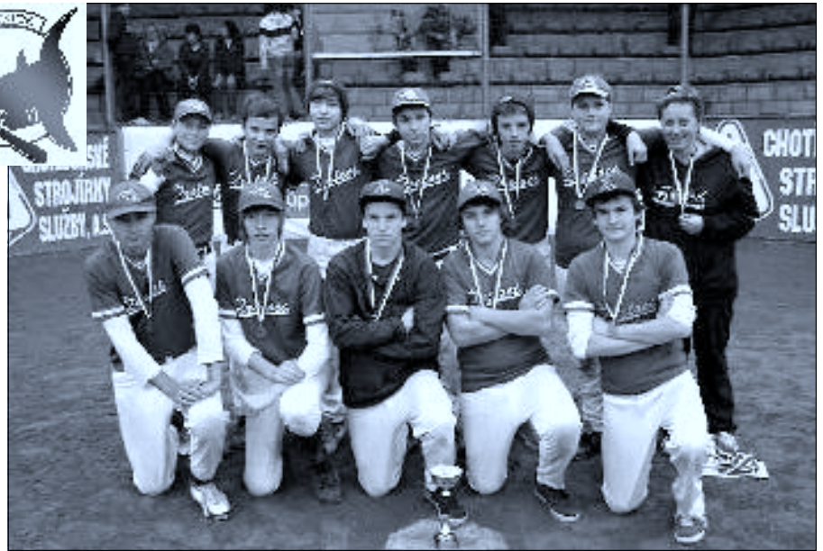
foto z Mistrovství ČR kadetů