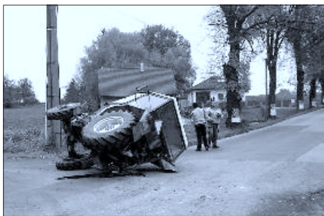
Další nehoda se odehrála v pondělí 22. října dopoledne na křižovate ulic Dr. Stejskala a Zalinská. Traktor údržby městyse po srážce s osobním automobilem.