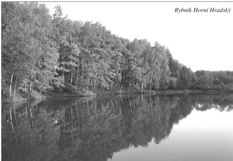
Rybník Horní Hradský