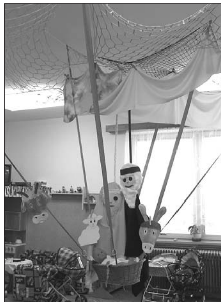
Vánoční výzdoba mateřské školy - výrobky výtvarného kroužku, některé za pomoci paních učitelky

pomoci dětem překonávat překážky v dnešní uspěchané době. Dětská relaxace je vhodná cesta ke zklidnění příliš aktivních dětí i pro uvolnění napětí dětí precitlivělých.