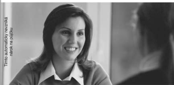
Tímto automaticky nevzniká nárok na půjčku

Když si chcete půjčit peníze, ne vždy se setkáte se vstřícným jednáním. My své klienty dobře známe. Denně jim pomáháme. Mluvíme s nimi a snažíme se jim porozumět.