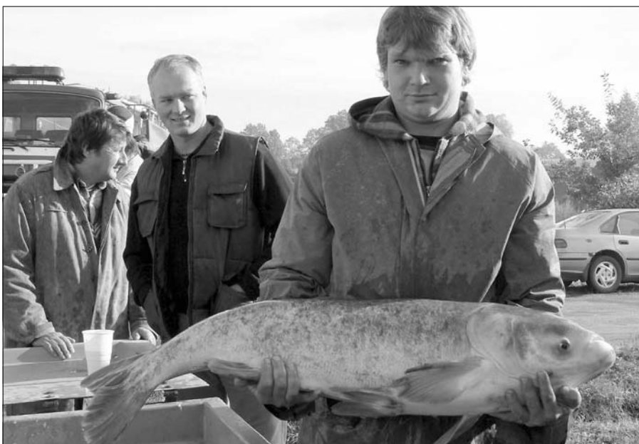
I takové „kusy“ byly sloveny v lednickém revíru – tolstolobik bílý