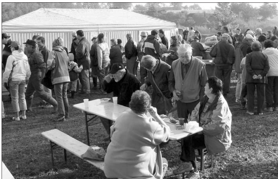
U stánku s občerstvením bylo plno, dokud se všechny pochutiny nevyprodaly