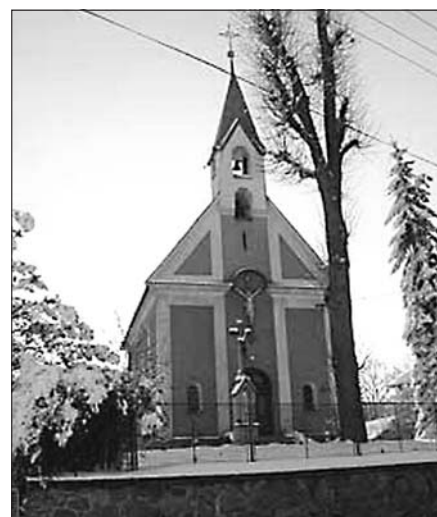
Kaple sv. Jana Křtitele ve Zborově u Šumperka

Ale i v České republice má Zborov svého jmenovce. Obec se stejným názvem je u Šumperka v podhůří Jeseníků. V nadmořské výšce