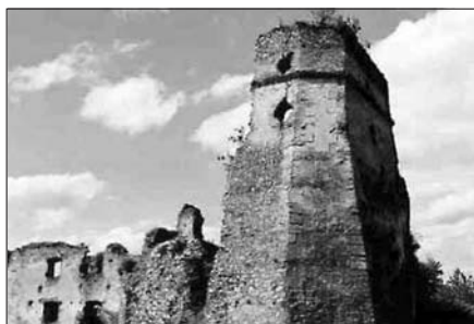
Zřícenina slovenského hradu Zborov

Další Zborov (2900 obyvatel) leží na východním Slovensku v okrese Bardejov a může se pochlubit mnoha zajímavostmi. Stojí zde hned pět kaplí a dva kostely, které oba byly velmi poničeny za první světové války. Ze tří panských zámků zůstal pouze jeden, a to ještě v podobě zříceniny, ostatní byly zbořeny. Na židovské osídlení upomínají zbytky synagogy a hřbitov. Další dva hřbitovy jsou věnovány obětem první a druhé světové války. Nad obcí se vypíná zřícenina královského hradu ze 13. století zvaného též Makovica. Vznikl na ochranu uhersko-polské hranice, v 16. století byl významně rozšířen a později ho vlastnili i známí revolucionáři František Rákoczi a Imrich Tököly. V roce 1684 byl hrad císařským vojskem zbořen a zůstal opuštěný; těžce poškozen