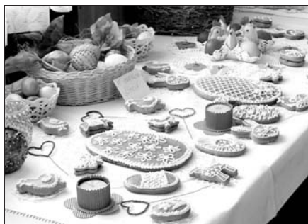
Foto: ukázky výrobků na velikonoční výstavě