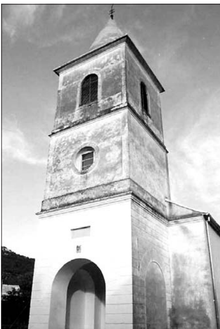
Kostel Panny Marie Karmelské v Ledenicích