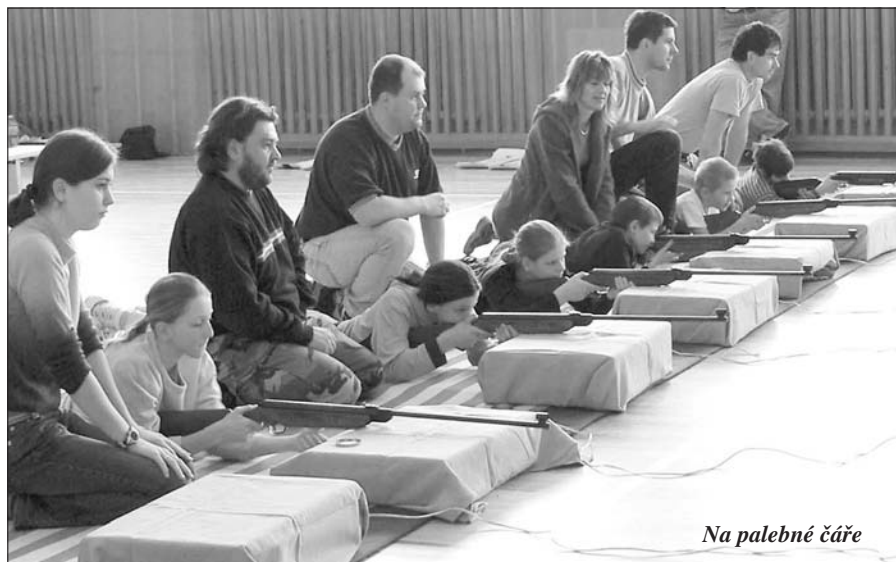
Na palebné čáře