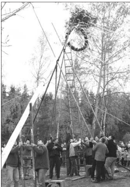
... a už se staví ...

Jisté je i to, že veliký dík patří nejen našim rybářům, které příprava takovéhle akce stála mnoho času a práce, ale i vám všem, kdo jste se přišli alespoň chvíli podívat. (J.K.)