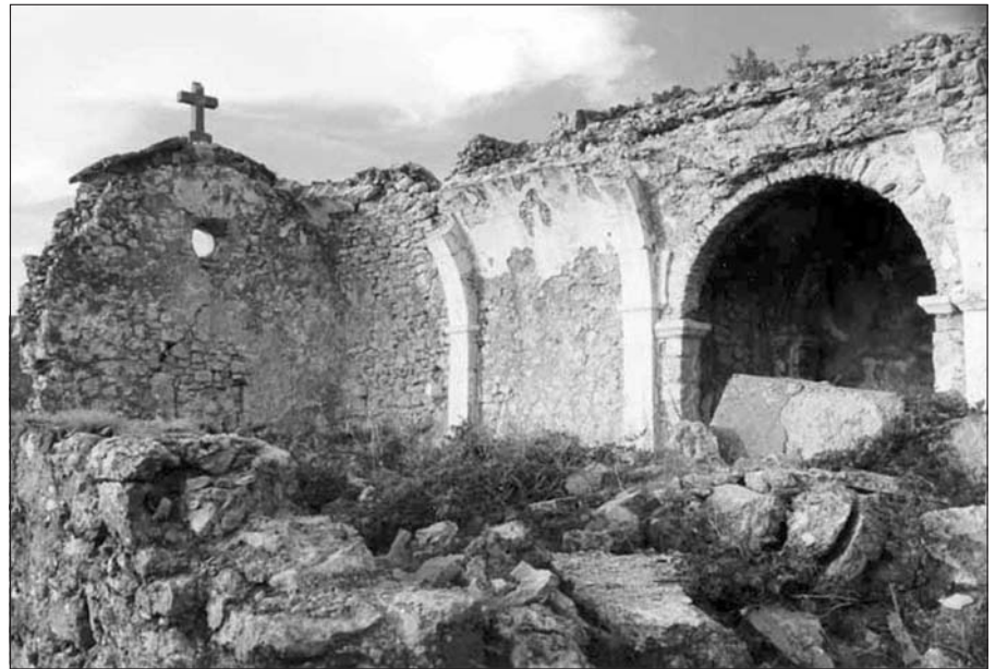
Zbytky kostela sv. Štěpána nad obcí

Odjezd autobusů: Ledenice 18,15 – Borovany 18,30 – Kaplice 18,00 hod.