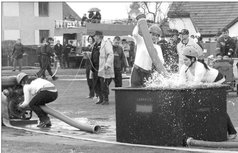
Družstvo ledenických žen v akci