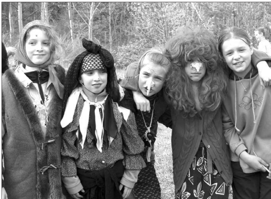
„Válečná“ porada čarodějnic

vý program různých soutěží děti dostatečně zahřál, ale uchránit se bahna bylo nemožné. S přibývajícím časem a lidmi, úměrně přibý-