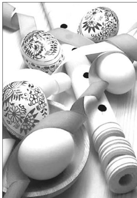
Krásné Velikonoce a radost z každého prožitého dne přeje redakce LZ