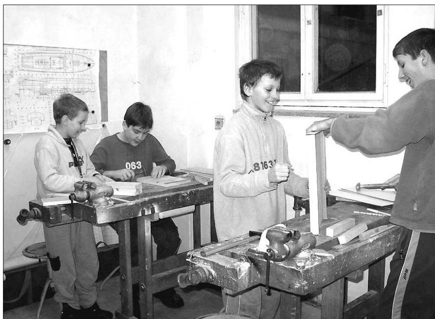
← Z výletu do Trocnova