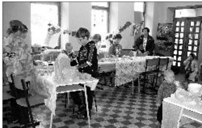
Foto z keramického kroužku

Milé děti, maminky, tatínkové, babičky a dědečkové, vítajte v nových prostorách Rodinného centra Ledňáček Ledenice (v bývalém obchodě vedle pošty). Zároveň děkujeme obci za to, že zde můžeme na přechodnou dobu být.