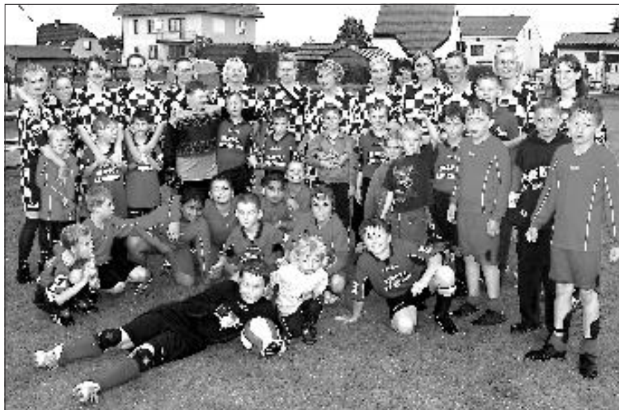
Příprava Slavoj Ledenic – dokopná 2010