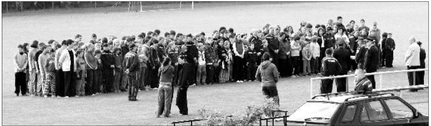
Nástup dětí na dvojboj