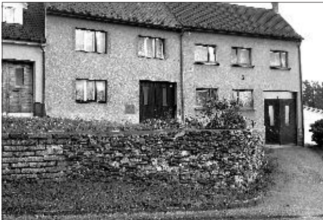
V měsíci květnu byl opraven rozpadající se kamenný taras u silnice Dr. Stejskala.