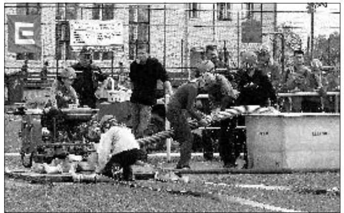
Družstvo starších dětí v akci