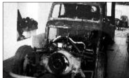
Tatra 57B před rekonstrukcí