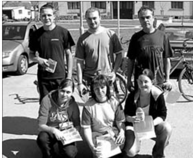
Vítězové v kategoriích muži a ženy