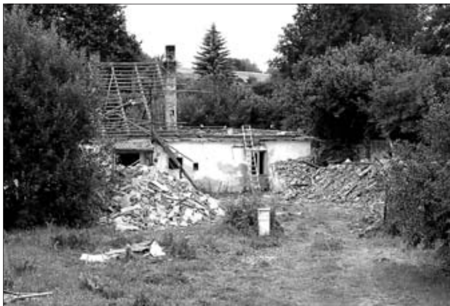
↑ Prostor kolem zbouraného domu č.p. 74 pod hrází rybníka Lazna byl zbaven pařezů, bagr zarovnal terénní nerovnosti a nyní je připraven pro další využití dle územního plánu, foto -jic- a -jk- ↓