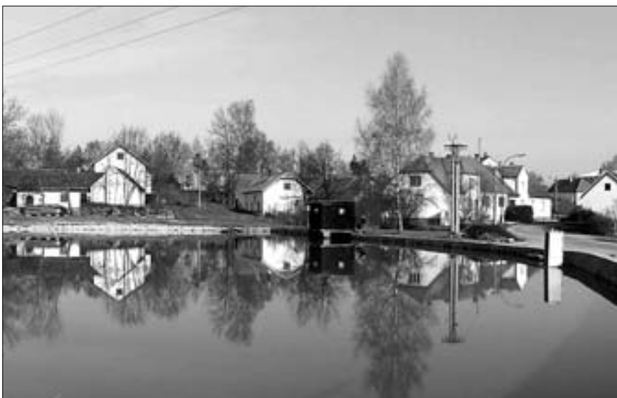
V dubnu byla dokončena oprava opěrné hráze a vypouštěcího zařízení rybníka Parčák včetně terénních úprav