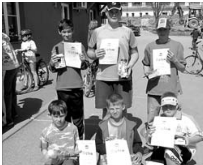
Vítězové dětských kategorií