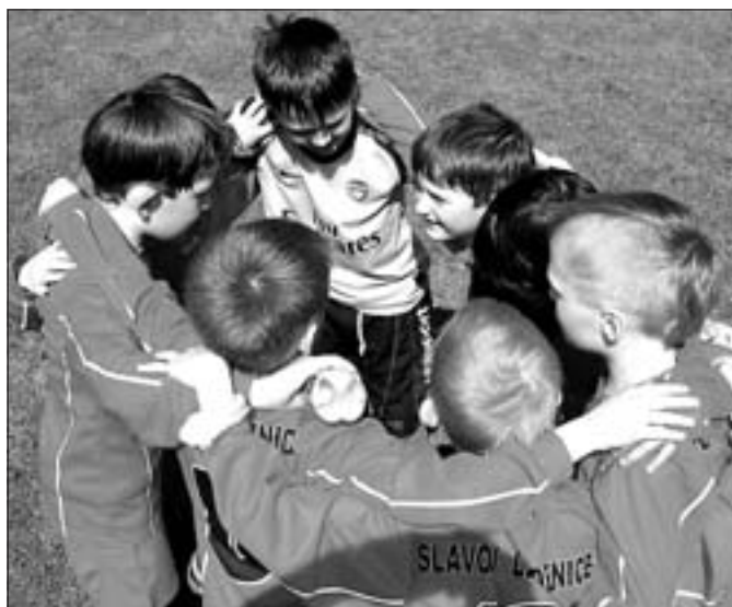
Základem všeho je dobrá parta!