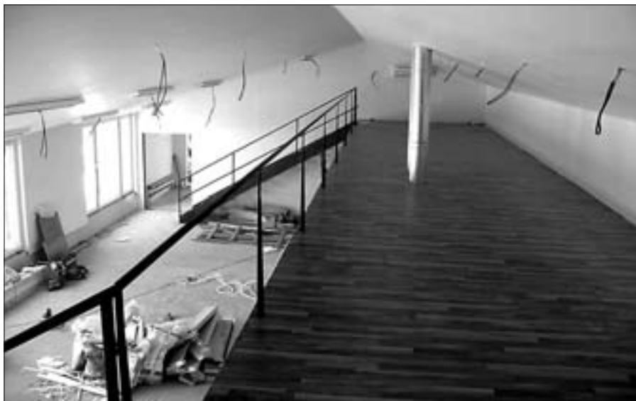
Nová třída MŠ s mimoúrovňovým prostorem pro spaní před dokončením