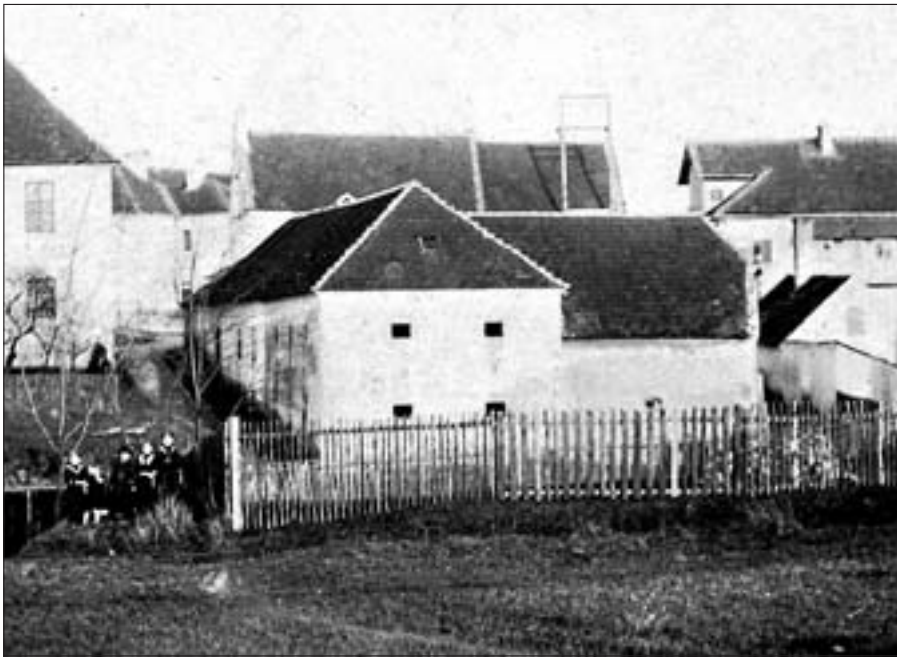
Bývalý pivovar od západu kolem roku 1920 (vlevo fara, vpravo dům čp. 83 – Duda)