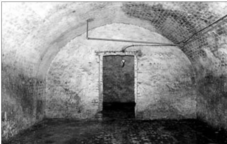
Zachovalý pivovarnický sklep pod radnicí.