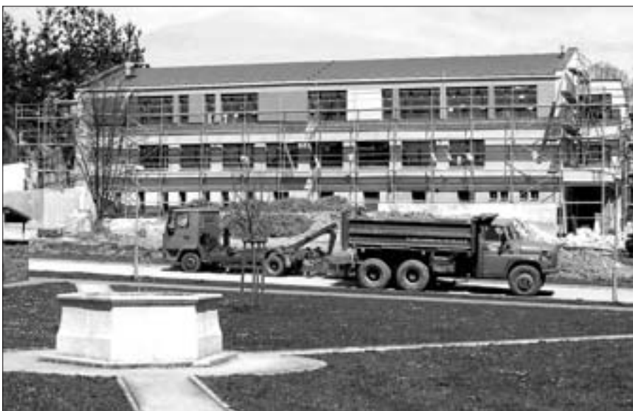
Fasáda MŠ již začíná zářit veselými barvami a v plném proudu jsou i terénní úpravy kolem budovy