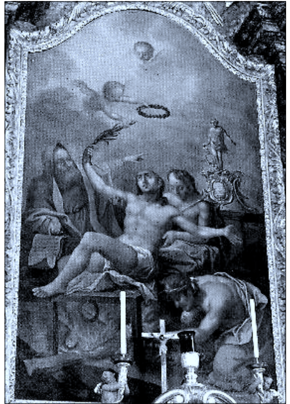
Oltářní obraz sv. Vavřince na roštu

Co vlastně způsobilo, že se Vavřinec stal tak populárním světce? Pochází ze Španělska, což má svůj význam v růstu jeho úcty. Jeho kult se rozvinul ve 13. století, které se snažilo o novou evangelizaci a obracelo se k jednotlivému člověku, aby se rozhodl pro Krista sám. Na počátku našich křesťanských dějin se za lidi rozhodovali panovníci. Ti přijali křesťanství a s nimi je povinně přijali i poddaní. Ve 13. století se však v církvi objevily proudy, které chtěly v duchu sv. Františka, sv. Dominika a velkých žen středověku, aby se křesťan rozhodoval celým srdcem pro Krista sám. Ač je to možná paradox, právě Španělsko darovalo světu základní chartu lidských práv, v ní čteme prohlášení Francisca da Vitoria (slavného profesora ze španělské Salamanky), kterým se zastává obyvatel v právě objevených světadlích: „Člověk se nerodí jako otrok. Země podle přirozeného práva patří domorodcům a nikdo nemá právo jim brát