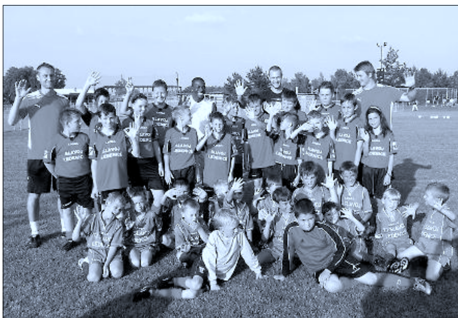
Program ukázkových tréninků s profesionálními trenéry JČ. FA ČR byl 19. 6. 2012 zahájen v Ledenicích