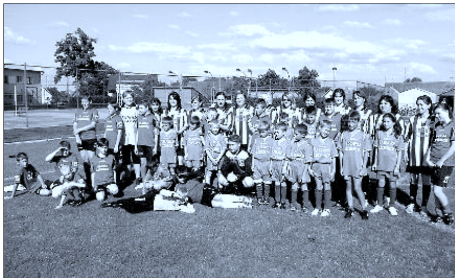
Fotbalová dokopná mladších žáků a starší a mladší přípravky – zápas proti maminkám