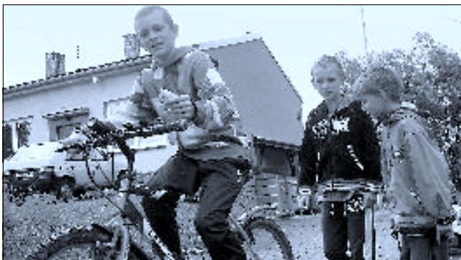
Dětský den v Ohrazení