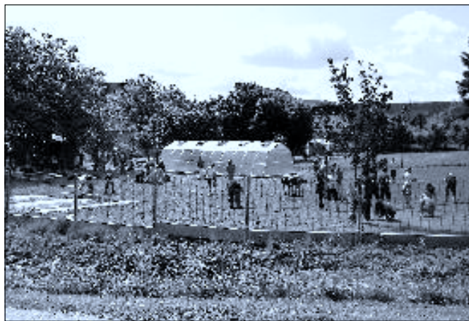
Nová školní zahrada. Ruku k dílu přiložili i žáci ZŠ

Nejprve bych chtěl zmínit pořady, které nedávno proběhly. S kladným hodnocením byla občany přijata slavnost otvírání mostu, která se dle mého názoru opravdu vydařila. Tradičně dobrou návštěvnost měl Dětský den i Festival mladých regionálních kapel. A naprosto nečekaný úspěch sklidilo v červnu Hroší prozatímní divadlo z Borovan. Jen uvedu, že kapacita divadelního sálu je 108 míst a na představení Paroháči aneb Červené kalhoty se přišlo podívat 145 diváků. Někteří se již do sálu nevešli a představení nemohli zhlédnout. Proto jsme se s borovanskými ochotníky domluvili na repríze v září letošního roku. Aby byli diváci spokojeni, připravíme na září místenkový předprodej.