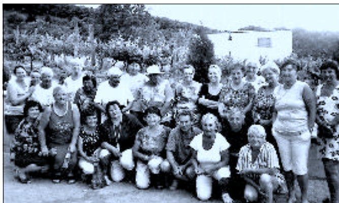
ZO SPCCH pořádala týdenní pobyt v Podhajskej na Slovensku. Zúčastnilo se 44 zájemců ke vši spokojenosti.