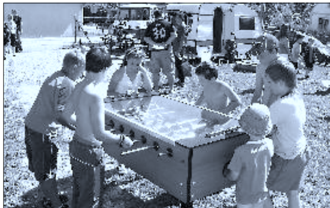
Dětský den v Trocnově