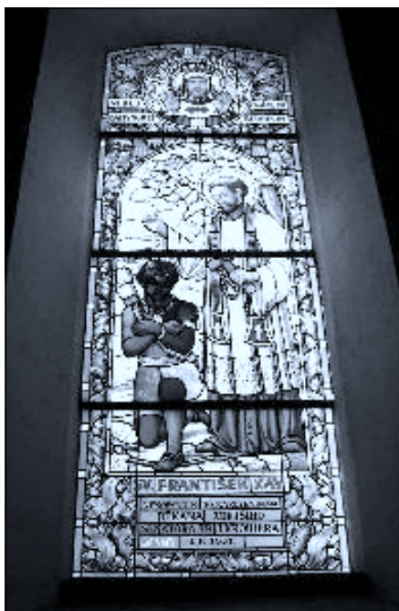
Okno v ledenickém kostele darované farníky ze Kroihherových šedesátinám