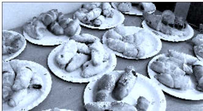
Svatomartinské rohlíčky žáků 6. třídy

Formuláře jsou k dispozici v sekretariátu starosty městyse Ledenice a na webových stránkách www.ledenice.cz (formuláře úřadu). O výsledku posouzení žádosti budou žadatelé vyrozuměni písemně do 30 dnů po projednání v Radě městyse. Při vyplňování příloh vyplní žadatel pouze údaje, které odpovídají příslušné akci.