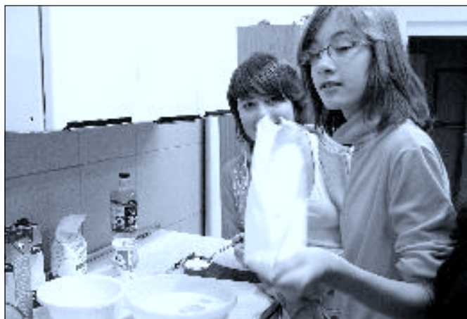
Sedmačky připravující rohlíčky

část projektu. Žáci připravují a pečou doma rohlíčky (tím mnohokrát děkujeme za trpělivost a spolupráci rodičů), ty pak přinesou do školy, část jich hodnotí mezi sebou a část pak ochutnává a uděluje body porota sestavená z učitelů a pracovníků školy. Rohlíčky byly s různými sladkými i slanými náplněmi a všechny byly výborné. Jako vítězové byli zvoleni všichni, kdo se do projektu zapojili, jelikož v tak nepřehledném množství vynikajících chutí nebylo možné určit jednoho vítěze.