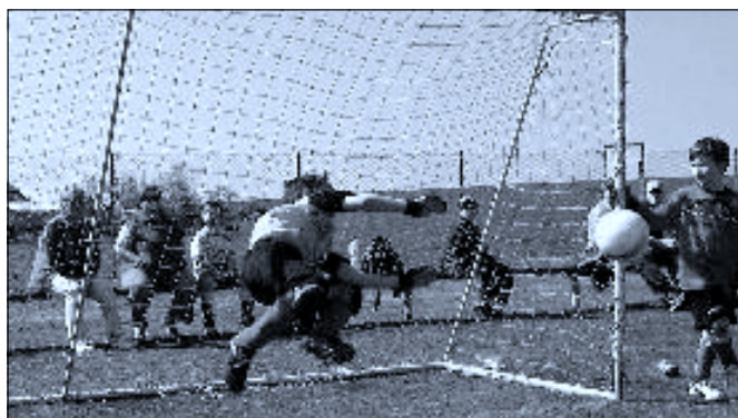
Fotbal to je zábava ...