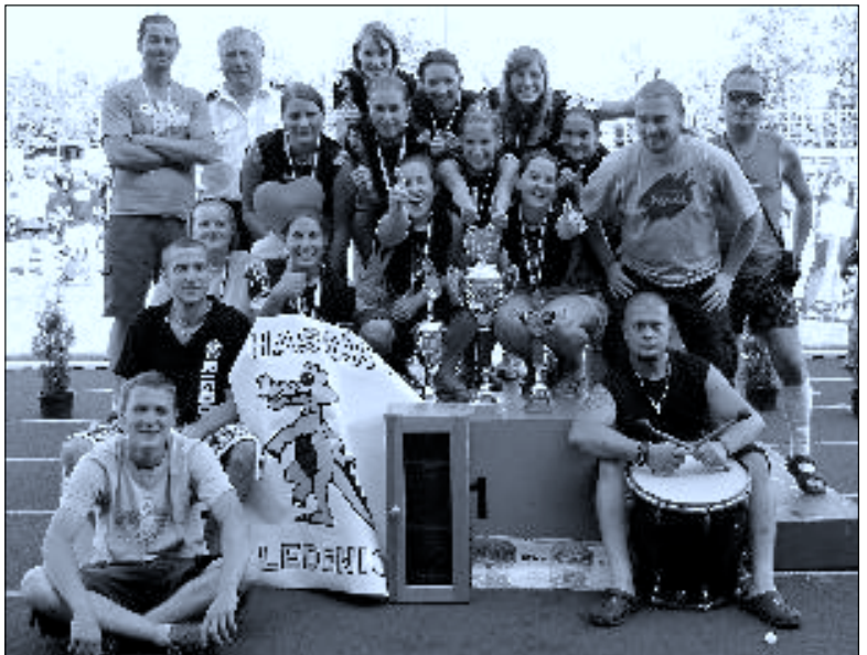
Zlaté družstvo s realizačním týmem