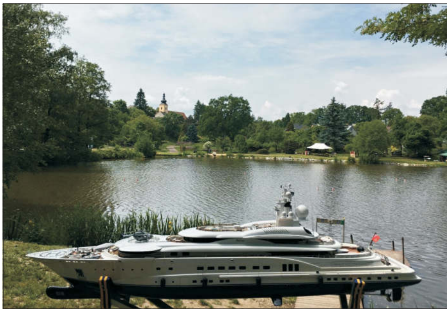
Od pátku 9. 6. do neděle 11. 6. se u rybníku Lazna uskuteční soutěž Mistrovství ČR lodních modelářů. K vidění budou soutěžní lodě i modely skutečných plavidel. Přijďte se podívat