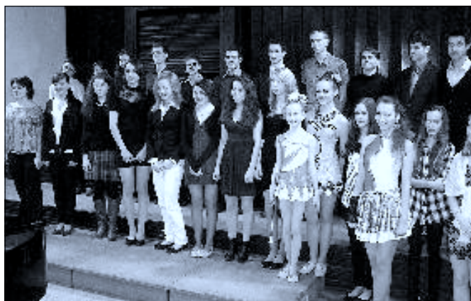
Na snímku někteří z oceněných