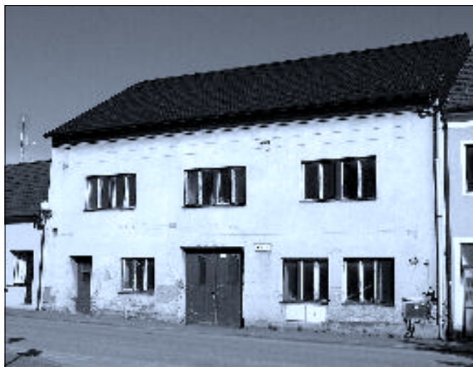
Současná podoba domu čp. 61