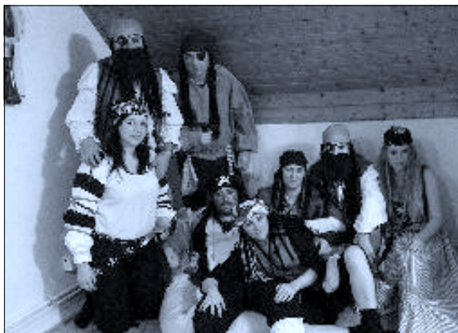
Maškarami nabitá sobota

Téma: Ledenická kostelní věž Kdy: čtvrtek 3. dubna 2014 od 18 h Kde: společenský sál DPS