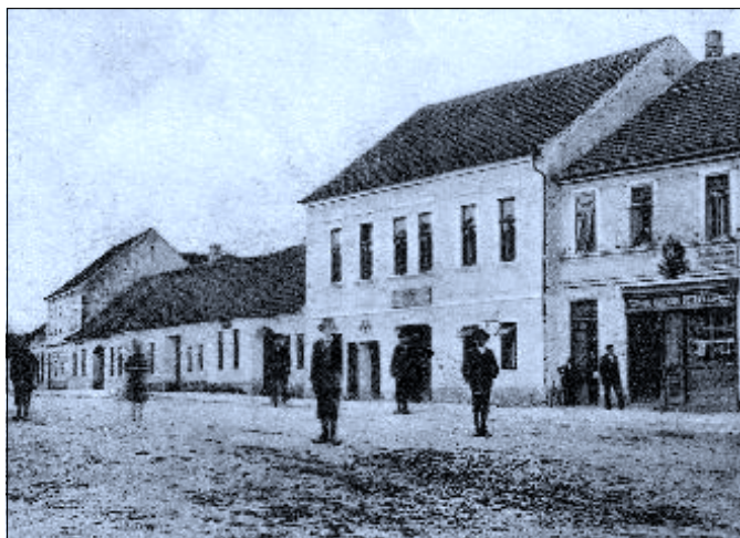
Zástavba na náměstí s výraznou budovou Sládkova hostince se před sto lety dostala na jednu z mnoha pohlednic s motivem Ledenic