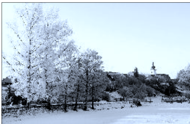
Pohled přes Laznu

Trocnovské medové Vánoce Vánoční prodejní výstava. Soutěž o nejhezčí medový perníček a vánoční aranžmá.