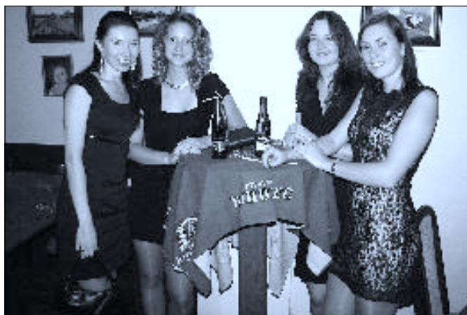
Kavárna Divadla U Hasičů